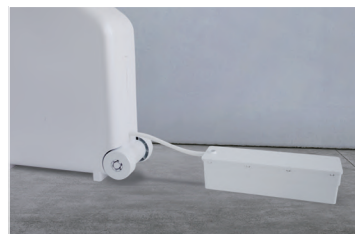
水の処理がしやすい ホース排水対応