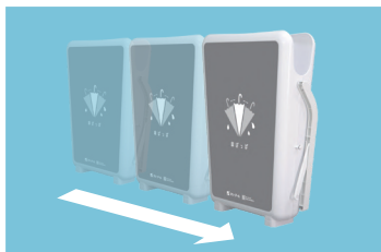
キャスター付で設置簡単