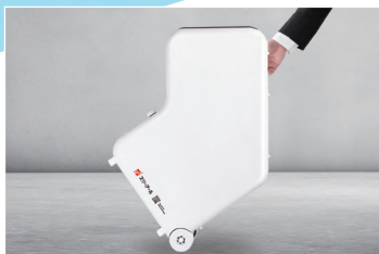
キャスター付で設置簡単