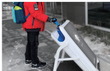
角度調整ができる