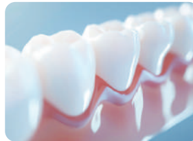
日々の口腔内チェックに

製品名：口腔内カメラ専用 使い捨てカバー(100枚入り) 型番：3R-ORL01-DC JAN：4589557955552