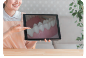
状態を確認しながらのカウンセリングに