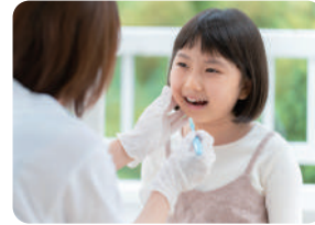
子どもの歯磨きトレーニングに