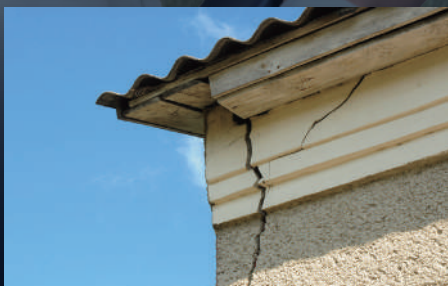
屋根や外壁の点検