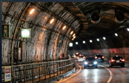
トンネル内壁のクラック検査