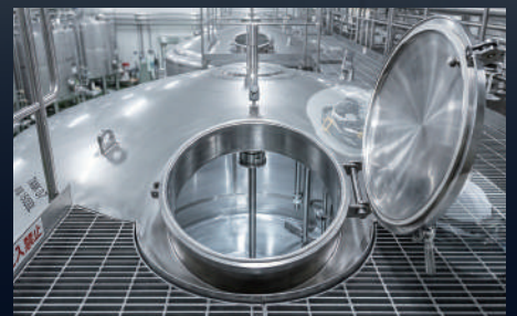
食品タンク内の検査