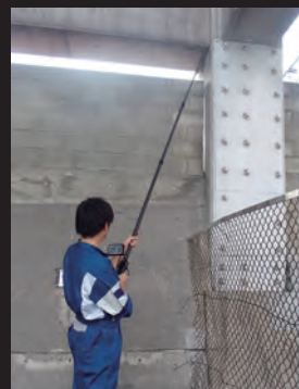
高い場所の設備点検