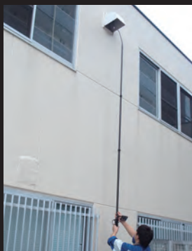
空調ダクトの確認