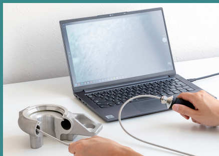
光源・カメラ内蔵型

適度なハリをもったスプリングケーブルで円形対象物にもかんたんに挿入可能。今まで見えなかった内側の様子も確認できます。