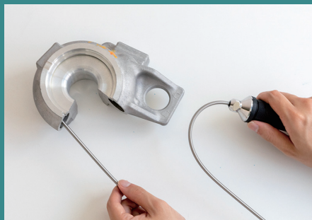
円形対象物も観察可能

適度なハリをもったスプリングケーブルで円形対象物にもかんたんに挿入可能。今まで見えなかった内側の様子も確認できます。